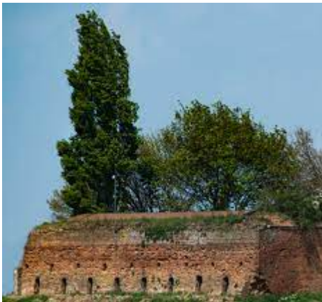
Veldoven in de Roswaard