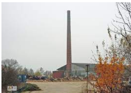
Boogconstructie van rode baksteen. De schoorsteen van de steenfabriek